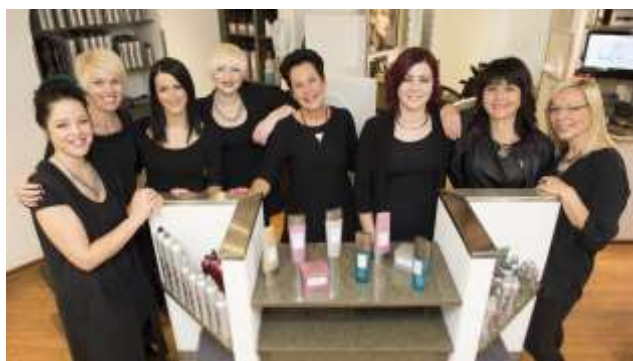
© 2015/16 SCHEFFL & SÖSSE, www.89016 Marktgemeinde Rauris. Foto für alle Funktionen zum eigenen Privatbedarf und eigener Öffentlichkeitsarbeit. Verbot der Weiterverbreitung. Ausdrucksdruck.