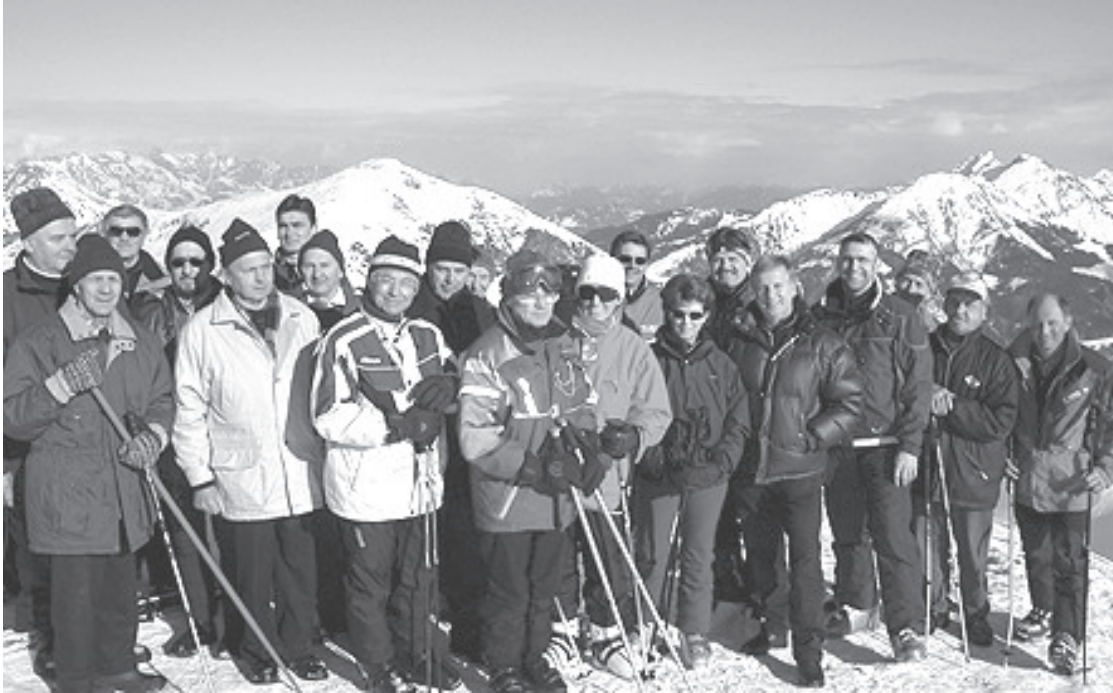
Einige, die an der Eröffnung bzw. Einweihung der neuen Rauriser Gipfelbahn teilnahmen, ließen es sich nicht nehmen, mit LH-Stv. Eisl „ganz hinauf“ zu gehen, um den herrlich Rundblick am Wetterkreuz zu genießen.

Schließlich gratulierte auch Landeshauptmann-Stellvertreter Wolfgang Eisl zum gelungenen Werk und meinte: „Ein notwendiger und richtungsweisender Schritt für Rauris, für den die bereitgestellten Landesmittel richtig eingesetzt sind“.