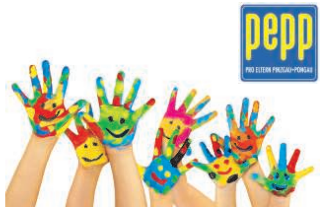
pepp - Pro Eltern Pinzgau + Pongau

Wir unterstützen Mütter, Väter, Omas, Erziehungsberechtigte gerne so früh wie möglich bei allen Fragen, die sich aus Schwangerschaft, Geburt und dem Zusammenleben mit einem Kind bis zum Schuleintritt ergeben und freuen sich auf Ihr Interesse! Mehr Infos im PEPP-Büro: 06542/56531 oder auf unserer neuen Homepage www.pepp.at .