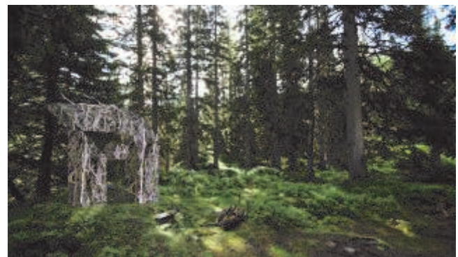
Neuinszenierung Rauriser Urwald

Wie ist der Rauriser Urwald entstanden? Welche Tiere und Pflanzen haben hier Ihren Lebensraum? Antworten auf diese und viele andere Fragen erhalten die Besucher auf den neu restaurierten Lehrweg durch den Rauriser Urwald.