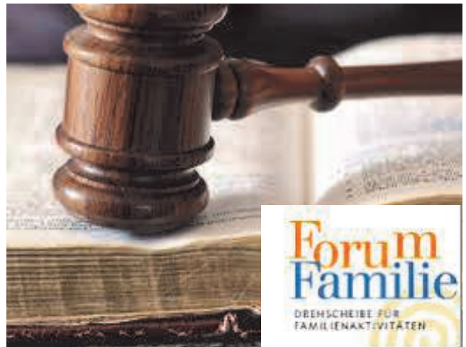
Ehe- und Lebensgemeinschaft unterscheiden sich aus rechtlicher Sicht in wesentlichen Punkten.

e-mail: forumfamilie-pinzgau@salzburg.gv.at