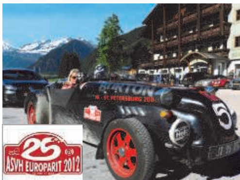
Start 25. Europarit

Zum Saisonauftakt fand heuer erstmalig die Hüttengaudi auf der Gainschniggalm statt. Trotz Regen und kühlen Temperaturen wanderten zahlreiche Gäste und Einheimische zur Almhütte um die Stammtisch-Musi bei ihrem Auftritt kräftig zu unterstützen. Auch die „Gstanzl-SängerInnen“ gaben ihr bestes und unterhielten das Publikum mit witzigen und humorvollen Reimen.