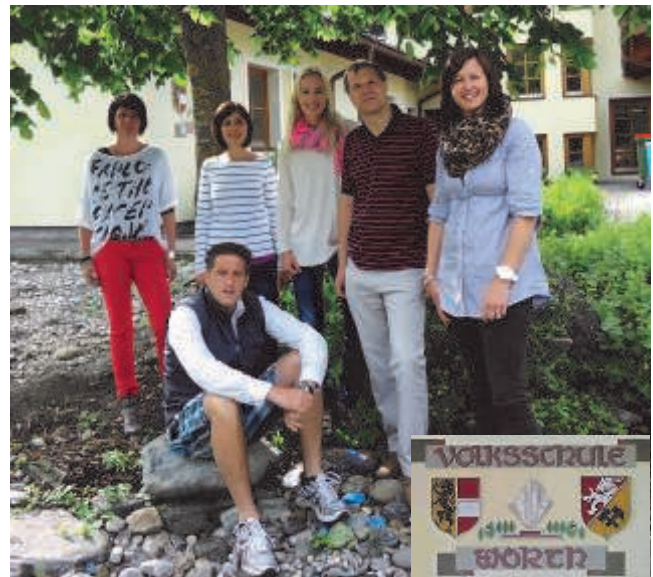
Lehrerschaft der VS Wörth

Vielen Dank - Die Lehrerschaft der VS Wörth