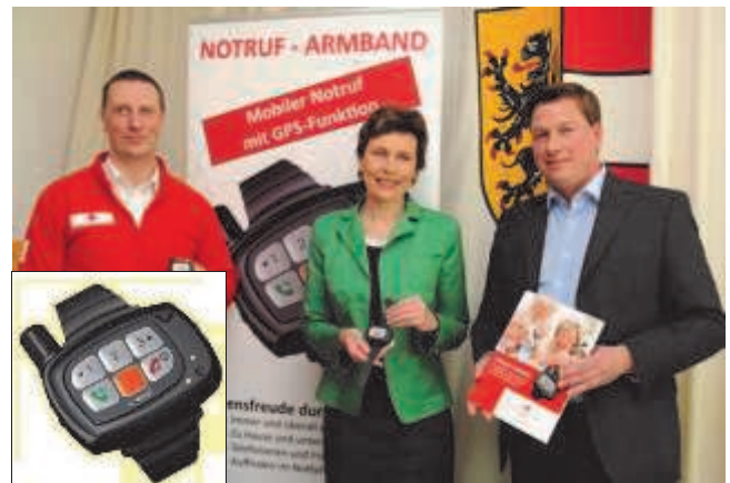
Rot-Kreuz-Rufhilfesystem ab sofort auch mobil

Nähere Informationen zur neuen mobilen Rufhilfe erfahren Sie ab sofort bei der Info-Hotline unter der kostenlosen Telefonnummer 0800 - 80 80 01.