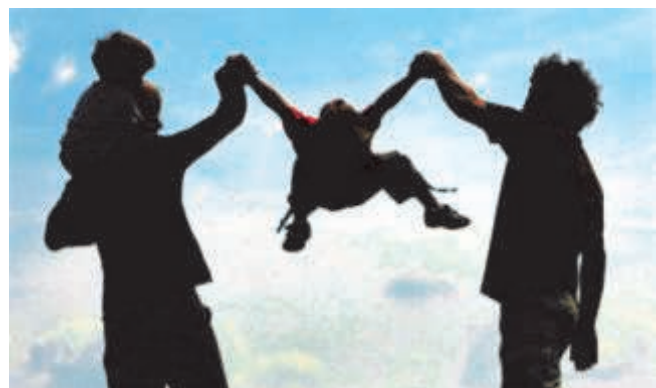
Fachlich geleitete Gruppe für Eltern oder Betreuungspersonen und ihre Kinder.