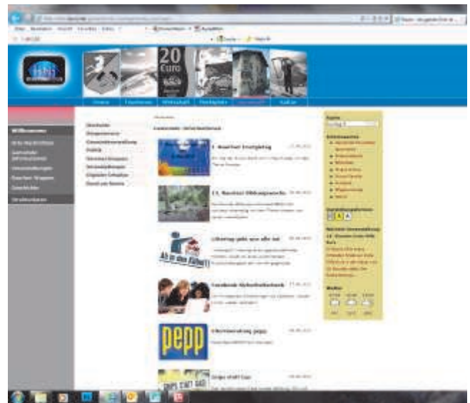
www.rauris.net Rubrik Gemeinde