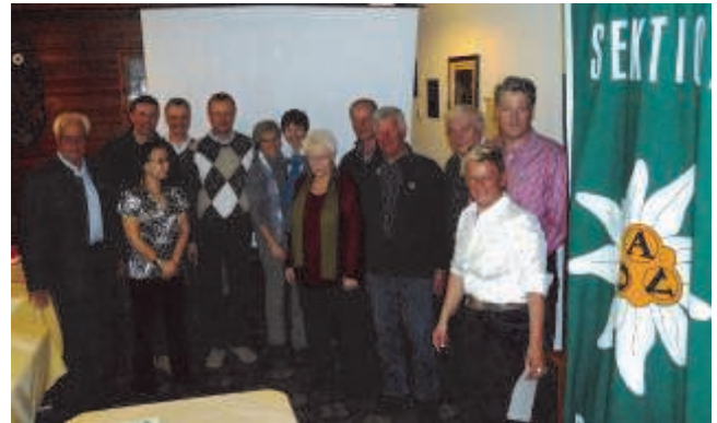
Ehrung langjähriger Mitglieder

Als ÖAV Vorsitzende der Sektion Rauris möchte ich