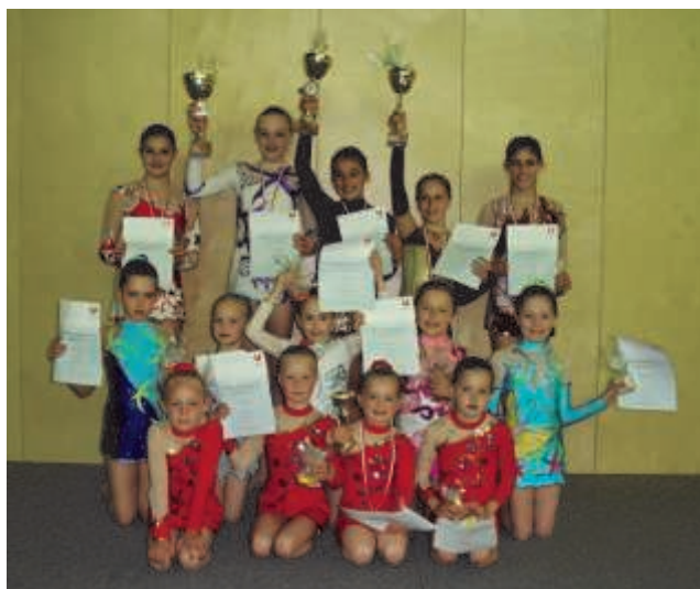
Gelungener Wettkampf in Rauris.