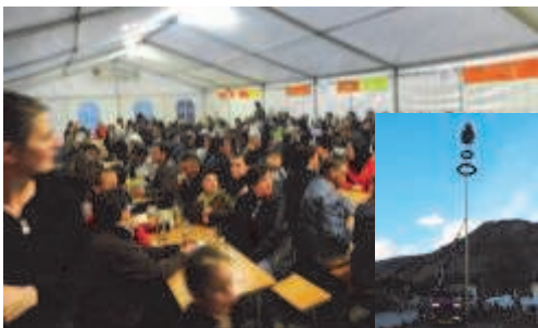
Zeltfest „Maibaum aufstellen“ FW Wörth

Die Gruppe „Hoamatgefühl“ aus Goldegg sorgte für gute Unterhaltung und fetzige Stimmung. Um das leibliche Wohl bemühten sich die mittlerweile legendäre „Schlauchturm-Bar“ sowie die Steak- und Schnitzelköche der FW Wörth.