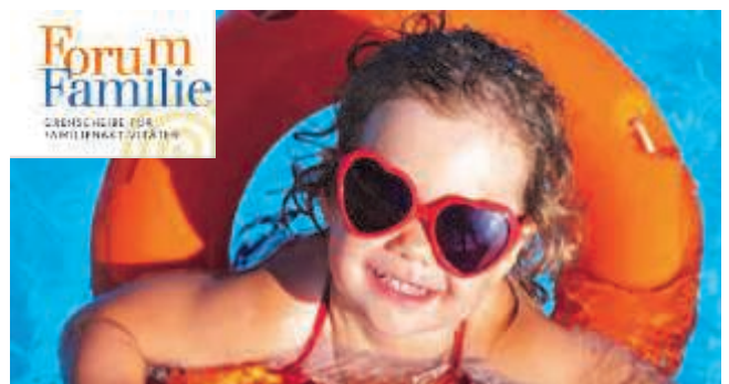
Ferienbetreuung für Kinder und Jugendliche im Sommer 2012.

Unter diesem Link finden Sie auch die Sommer Öffnungszeiten der Kinderbetreuungseinrichtungen und div. Camps im In- und Ausland.