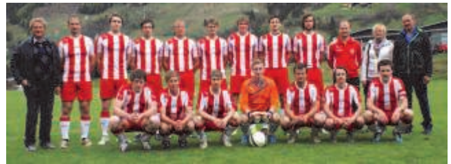
USK Rauris

Mit viel Begeisterung entstanden wahre Kunstwerke, für die die fleißigen Künstler mit schönen Geschenken belohnt wurden. Auf diesem Wege bedanken sich die beiden Volksschulen für die gute Zusammenarbeit in den letzten Schuljahren bei der Raika Rauris!