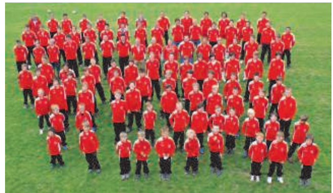
Neue Trainingsanzüge für den USK Rauris