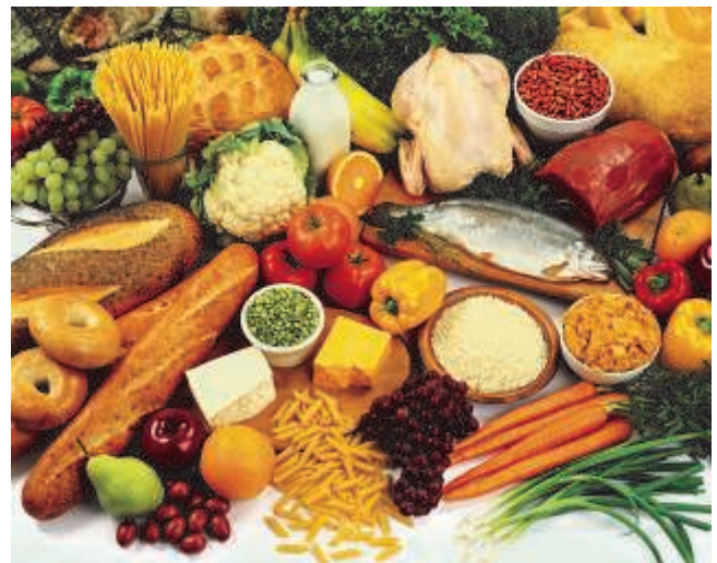
Wirf kein Essen weg!

Ein weiterer Tipp: gehen Sie mit Einkaufszettel einkaufen und nehmen Sie nur das, was auf dem Zettel steht.