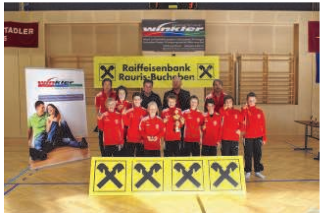
2. Hallenfußballcup