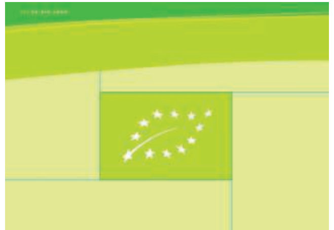
Ab 1. Juli 2012 gilt dieses Logo für Bioprodukte.

Die Erzeugung und Platzierung der Bioerzeugnisse mit Kennzeichnung folgt einem strengen Zertifizierungsprozess, der eingehalten werden muss. Wer Erzeugnisse mit dem EU-Logo kauft, kann sicher sein, dass mindestens 95 Prozent der Inhaltsstoffe landwirtschaftlicher Herkunft biologisch produziert wurden, dass das Erzeugnis mit den Regeln des offiziellen Kontrollprogramms übereinstimmt, dass das Produkt direkt vom Erzeuger oder Verarbeiter in einer versiegelten Verpackung kommt und dass das Erzeugnis den Namen des Erzeugers, Verarbeiters oder Großhändlers und den Namen oder den Kontrollcode der Kontrollstelle trägt.