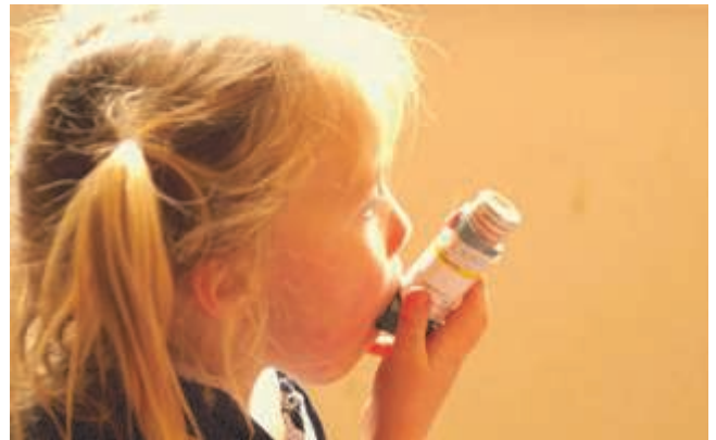
Asthma ist die häufigste chronische Krankheit bei Kindern.

Erstmals können also auch Laien mit Hilfe eines Lehrfilms konkrete Verhaltensweisen zur Selbsthilfe bei Asthma bronchiale lernen, so die Österreichische Gesellschaft für Kinder- und Jugendheilkunde, die die neue Patientenschulung gemeinsam mit der Abteilung für Kinder- und Jugendheilkunde des Krankenhauses Schwarzach erstellt hat.