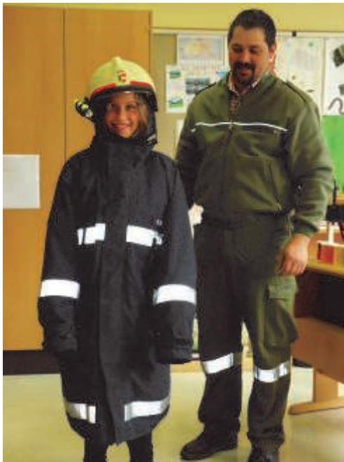
Früh übt sich....