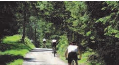
Bikestrecke „alte Buchebenstraße“