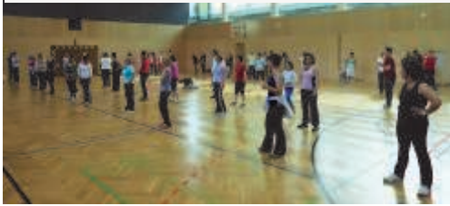
Fit im Leben!