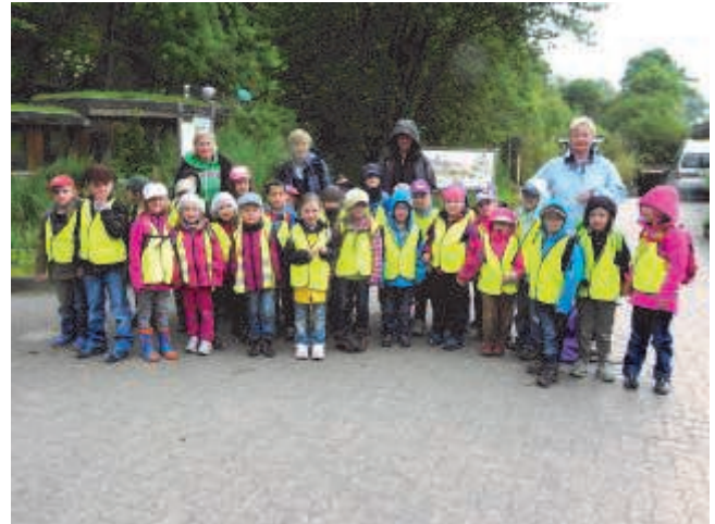
Ausflug der Schulanfänger in den Zoo nach Salzburg.