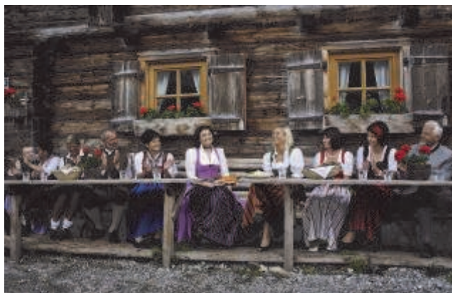
Feiertags-Frühshoppen auf der Kalchkendlalm