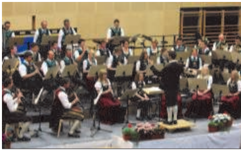
"Die Kraft der Musik" - Frühlingskonzert der TMK