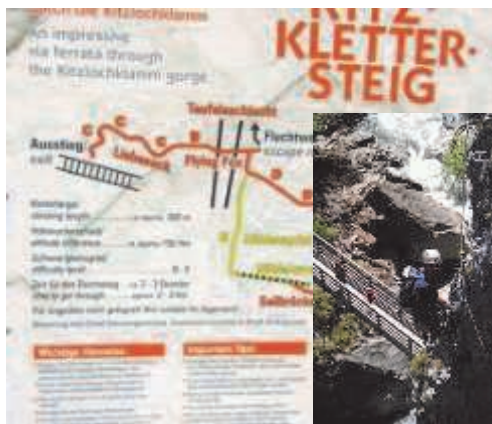
Neuer Klettersteig Kitzlochklamm

Am Schluss durften die Kinder noch eine Runde mit dem Löschgruppenfahrzeug mitfahren. Die Kinder der Volksschule Wörth, bedanken sich bei den Verantwortlichen des Löschzuges Wörth, für ihr tolles Engagement!