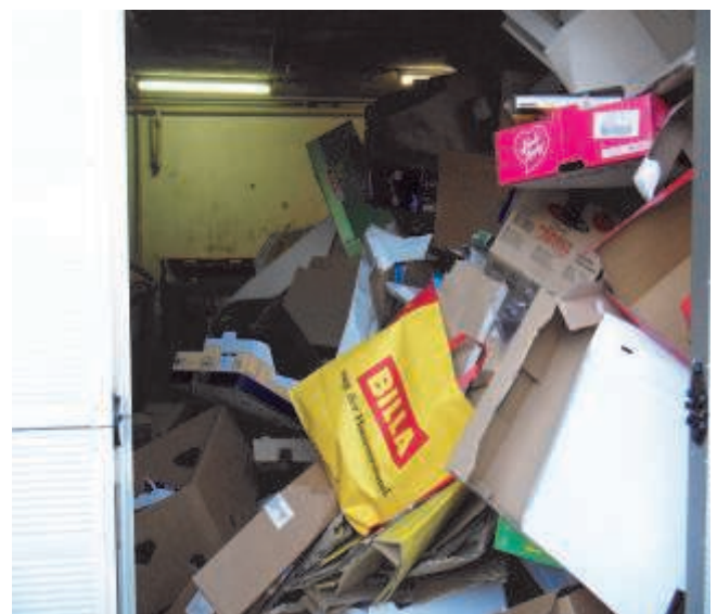
Kartonagen ehemaliger Gemeindebauhof am 3. Mai 2012!