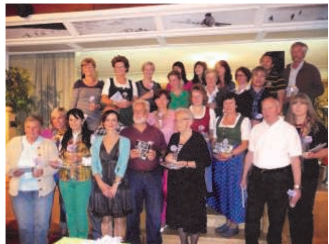
Foto- und Schreibgruppe Rauris