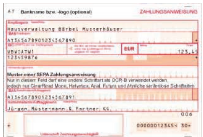
versandfertig beschriftet (Muster)